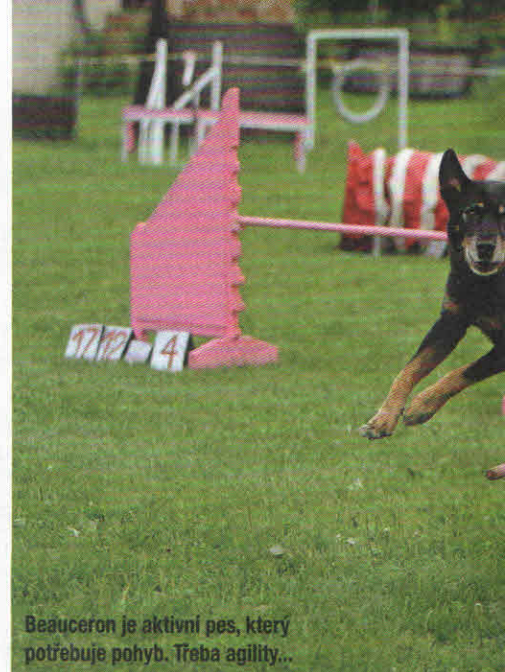
Beauceron je aktivní pes, který potřebuje pohyb. Třeba agility...