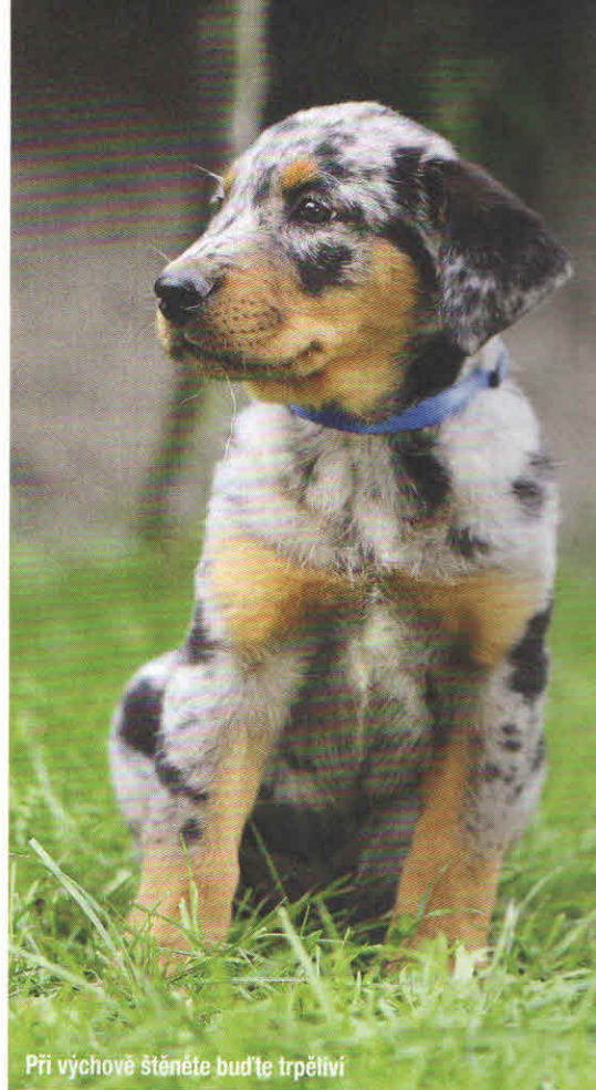
Při výchově štěněte buďte trpěliví

Beauceron je velmi učenlivé plemeno, které nepotřebuje neustálé opakování stejného povelu. Pokud ho umí, nezapomíná. Naopak stále opakování ho znechutí a spolupráce a kontakt s psovodem se